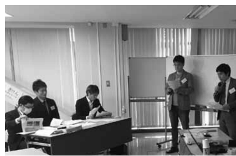
塾生によるゼミの検討成果の発表です

塾生の皆さんは、初めての事なので緊張して発表していましたが、慣れてくると時折ユーモアを交えながらの研究発表となりました。塾生の皆さんも、こうした事は初めてなので戸惑ったと思います。 このやり方について、感想を聞いてみると「身近な所で地域資産を再発見することができました」